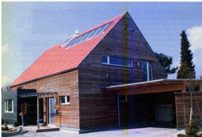
Der Eingangsbereich öffnet sich nach Osten. Im Norden schließt sich ein Carport an

Der Außenwandaufbau (von innen nach außen) besteht aus Streichputz, 10 mm Fermacell, 30 mm Lattung, 18 mm OSB-Platten, 356 mm TJI-Träger (e = 625 mm), 356 mm Zellulosedämmung (WLG 040), 16 mm Holzfaserplatte