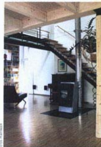
Der Pelletsofen im Wohnzimmer fungiert als „Notheizung“. Über eine einläufige Holz-Stahltrappe gelangen die Bewohner ins Obergeschoss